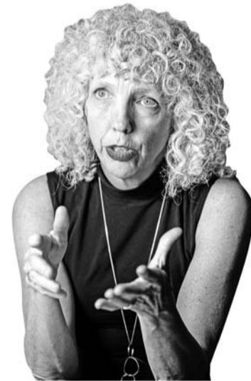
제니퍼 모건 그린피스 국제본부 공동 사무총장.