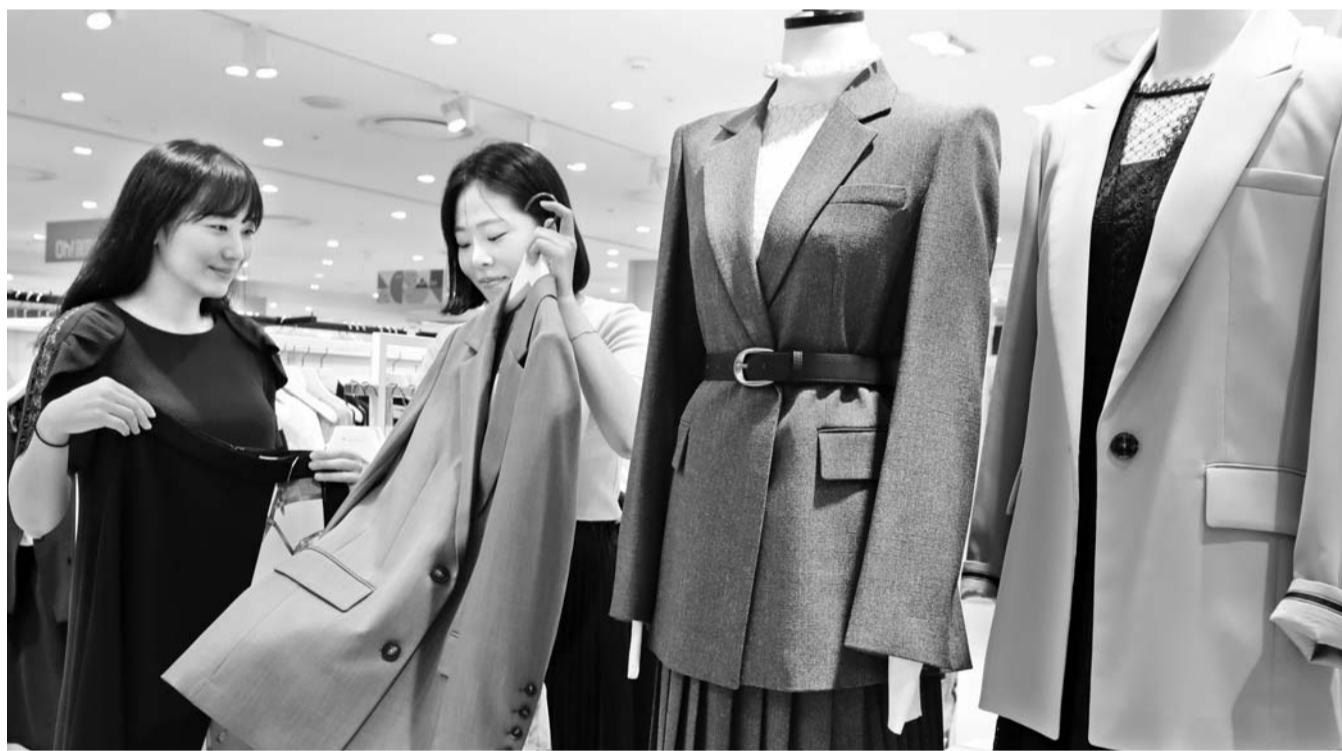
롯데백화점 광주점은 오는 25일까지 가을 신상 의류를 10% 할인 판매한다고 19일 밝혔다.

이외 '질스투어트' '아이즈베리' '모조에스핀' '지코트' 등 브랜드는 일부 가을 신상품을 10% 할인 판매한다. /백희준 기자 bhj@