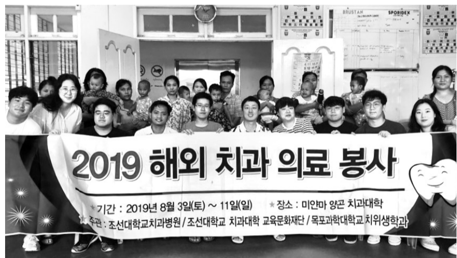
2019 해외 치과 의료 봉사 기간 : 2019년 8월 3(일) ~ 11(일) * 장소 : 미얀마 양곤 치과대학 주관 : 조선대학교치과병원 / 조선대학교 치과대학 교육문화재단 / 목포과학대학교치위생학과

조선대치과병원(병원장 손미경)은 최근 구강악안면외과 의료진을 중심으로 해외진료봉사단을 꾸려 미얀마 양곤 치과대학에서 구순구개열·구강암 환자들을 대상으로 무료수술 진료봉사를 펼쳤다.