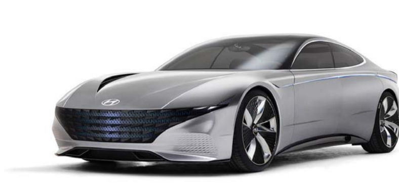
'파이널리스트(Finalist)'를 수상한 콘셉트카 '르 필 루즈'.