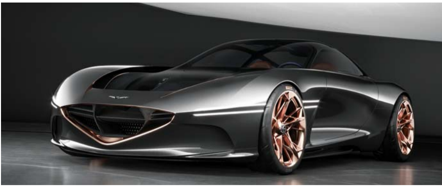
'2019 IDEA 디자인상' 금상 수상한 제네시스 에센시아 콘셉트.