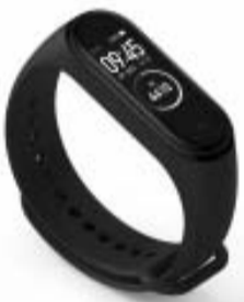
미 밴드 4

샤오미가 웨어러블 제품인 미 밴드 4, 무선 이어폰 등을 국내 정식 출시했다.