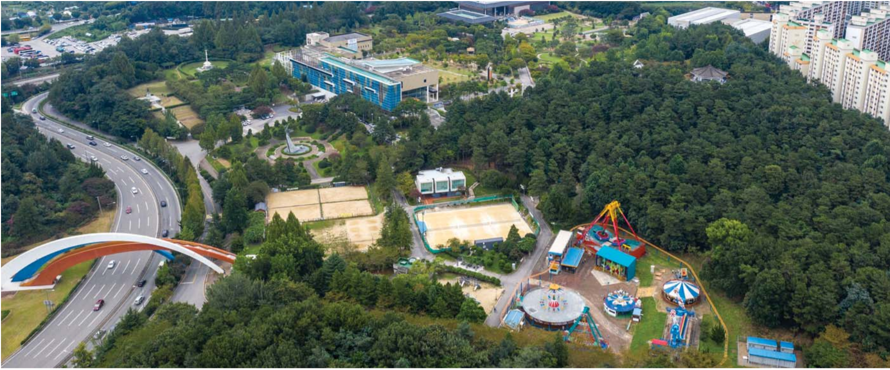
광주 중외공원을 자연과 예술이 함께 하는 체험 문화공간으로 조성하는 '아시아 예술정원 조성 사업'이 본격화된다. 중외공원 전경.