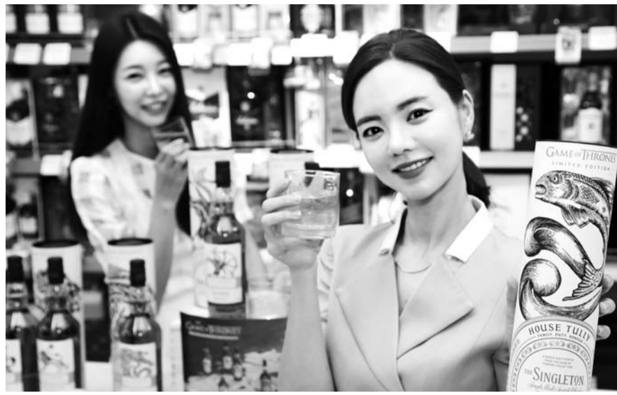
이마트가 추석을 앞두고 인기 미국 드라마 '왕좌의 게임' 콜라보 위스키 한정 세트를 선보이고 있다. 이마트 유통점 주류 매장.

최후의 이마트 마케팅 담당은 "명절 연휴에 가족 먹거리용으로 구매하는 '자기소비형' 세트 매출이 점차 확대되는 추세여서 올해는 종류를 확대했다"고 말했다.