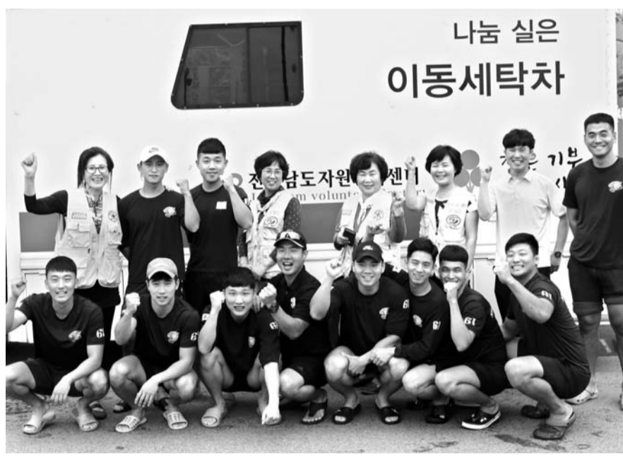
담양군은 전남도자원봉사센터와 연계해 백동주공 2차아파트 주민들을 대상으로 찾아가는 이동세탁봉사활동을 했다. <사진>