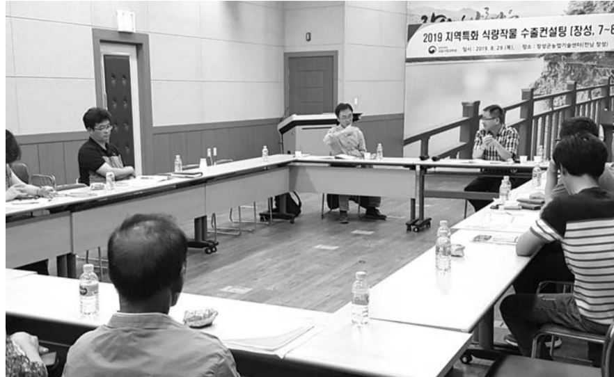
장성군은 지난 달 29일 장성군농업기술센터에서 수출 명품 쌀 계약재배 능가들이 참석한 가운데 '2019 지역특화 식량작물 수출컨설팅'을 개최했다.

서 수출용 쌀인 조생종 벼를 첫 수확한 바 있다. 이날 수확한 벼는 '조명'으로, 지역 내에서 수출명품 햅쌀단지를 육성하기 위해 도입한 조생종 신품종이다. 밥맛이 뛰어나 소비자들에게 인기가 높다. 군은 장성군농협통합RPC, NH농협무역과 계약재배를 통해 200ha 면적에 조명 1호 품종을 단지화해 생산하고 있으며, 국내시장은 물론 러시아, 미국 등 해외로도 수출하고 있다. 이밖에 벼농사에 필요한 상토 및 맞춤형 비료, 육묘상차처리제, 공동방제 등 고품질 쌀 생산을 위한 맞춤형 지원을 해 농가의 경영비 부담을 줄일시키고 있다. 지난해에는 단보(300평) 당 524kg의 수량으로 전남지역 내 쌀 수확량 1위를 기록