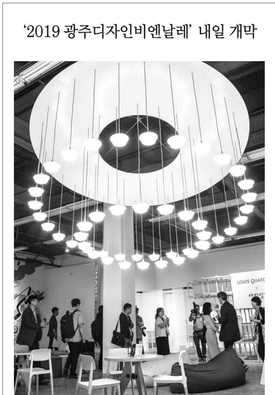
7일 공식 개막하는 2019 광주디자인비엔날레가 5일 비엔날레전시관에서 열린 프레스 오픈을 시작으로 일정을 시작했다.

KT전남고객본부 관계자는 "KT는 다른 통신사보다 광주·전남 지역에 기지국을 많이 설치했다"며 "앞으로 수도권 등 일부 지역에 5G 커버리지가 집중되지 않도록 3단계 계획에 따라 전국 커버리지를 확대해나갈 예정이다"고 말했다. /김현명 기자 young@kwangju.co.kr