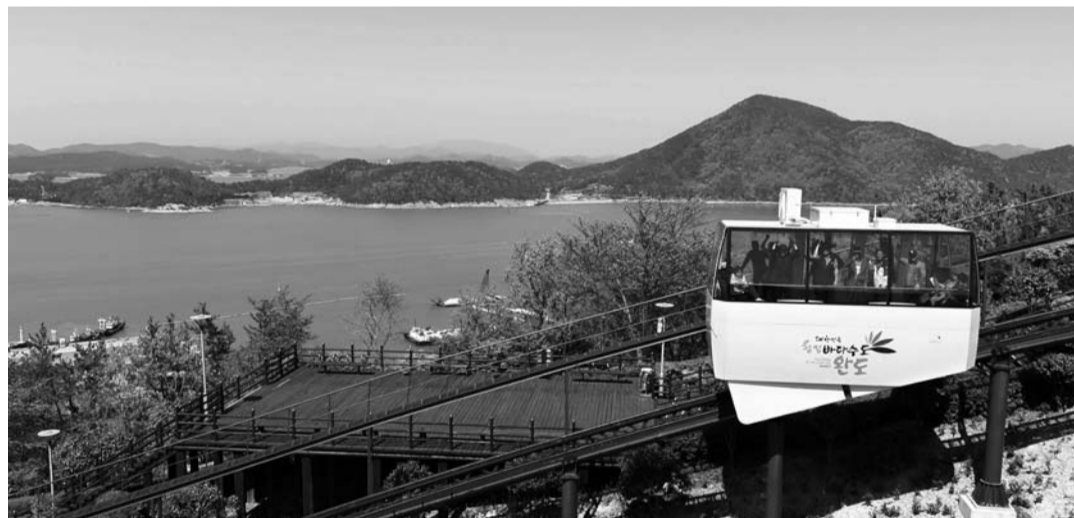
다도해 일출공원 입구에서 완도타워 중앙광장까지 운행하는 '모노레일'.