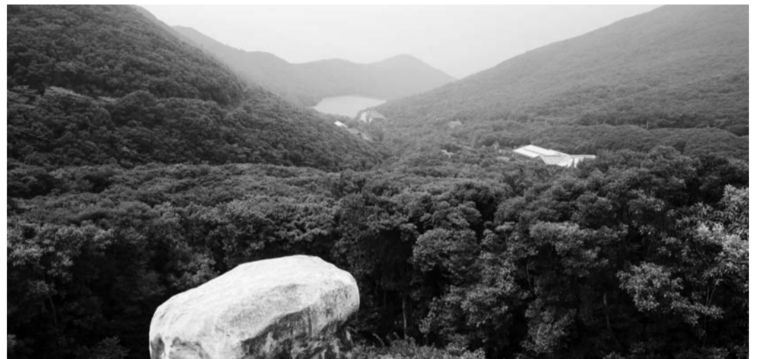
완도군 군외면 아늑한 골짜기에 자리한 '완도 수목원'. 1전망대에 오르면 수목원이 한눈에 내려다보인다.