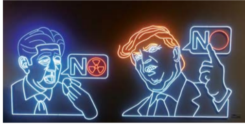
배철수·신해성 작 '동상이몽'