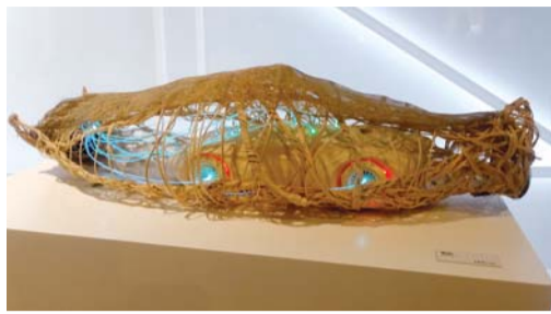
오용석 작 'Birth'

기아차 디자이너들은 "디자이너의 '상상'과 '생각'은 예술적 감성을 통해 성장한다"면서 "지난 10년간 다양한 소재와 장르의 실험을 통해 디자인의 원천인 창의력을 개발하면서 고객과 문화적으