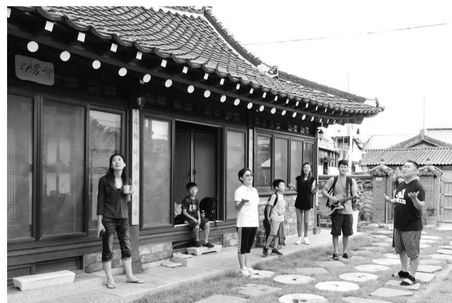
광주 여행자 플랫폼-다솜채

추가 지정했다. 동구 동명동 카페&게스트하우스 ‘희재가’에서는 광주에서 찍은 사진을 액자로 만들어 가져가는 ‘나만의 사진 꽃 액자 만들기’ 체험을 할 수 있다. 동구 대인동의 병원을 리모델링한 김내과는 국내의 유명작가의 작품 감상과 함께 여행자들이 교류하는 ‘김 내과 아트(ART)콘서트’ 등도 만나볼 수 있다. 광주에서 유일한 호스텔인 ‘오아시타’는 광주를 배경으로 한 ‘택시운전자’ ‘암살’ 등의 영화를 보고 영화해설사와 함께 촬영지를 둘러보는 ‘광주시네마투어’를 진행한다. 광산구 송정동에 위치한 한옥 게스트하우스인 ‘다솜채’는 심리치유 프로그램 ‘마음산책’을 운영한다. 동구 금동 ‘정글로’는 북카페, 빈티지 셀렉트숍, 여행기록소 등으로 꾸민 여행 공유공간이다. 여행자플랫폼 이용과 참여와 관련한 자세한 내용은 광주 도시여행정보 페이지(www.gjmiin.com)에서 확인할 수 있다. /최권일 기자 cki@kwangju.co.kr