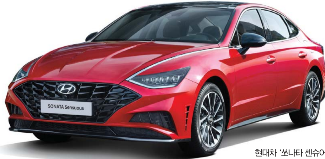
현대차 '쏘나타 센슈어스'