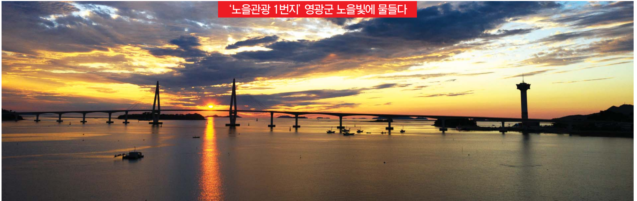
‘노을관광 1번지’ 영광군 노을빛에 물들다

아름다운 영광 칠산 앞바다의 붉은 노을이 칠산타워, 칠산대교와 어우러져 장관이다. 영광에서는 다음달 5·6일 이틀간 백수 해수온천랜드 일원에서 백수해안도로 노을축제를 연다.