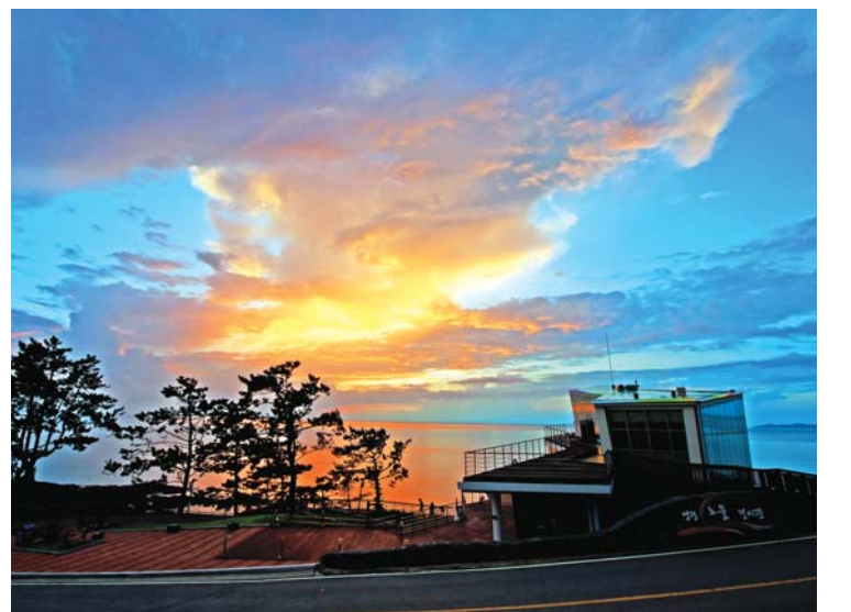
서해안의 노을을 감상할 수 있는 최적지인 노을전시관.