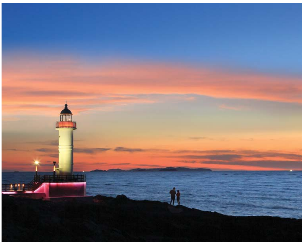
백수해안도로 노을 등대의 풍경이 아름답다.