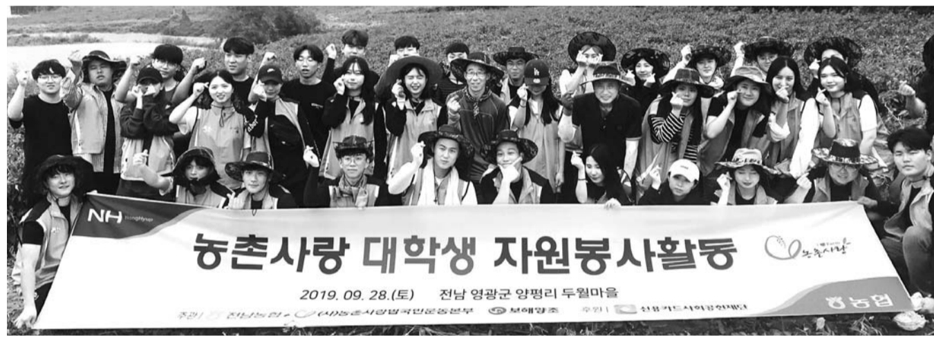
가을 수확철을 맞아 농협 전남지역본부와 보해양조 인쇄대학생 봉사단, 전남대 농업경제학과 학생 50명이 지난 28일 영광 농가를 찾아 일손돕기를 펼쳤다.

농협 전남지역본부가 겨울대파 수급안정을 위해 올해 진도지역 물량을 6600t으로 확대했다. 전남본부는 지난 25일 서진도농협 회의실에서 대파 농업인 200여 명을 초청해 '겨울대파 채소가격안정제 및 발작물 공동경영체사업' 설명회를 열었다고 최근 밝혔다. 농협은 이날 정부의 '채소가격안정제'와 지자체 사업비 편성계획, 농협 사업계획 등을 설명했다. 전남본부가 책정한 진도지역 대파 물량은 6600t으로 지난해 물량 1200t보다 5배 늘었다. '채소가격안정제'는 농협에 계약재배를 약정한 농가에 대해 평년 가격의 80% 수준인 보전기준가격과 시장 가격의 차액을 보전하는 제도이다. /백희준 기자 bhj@kwangju.co.kr