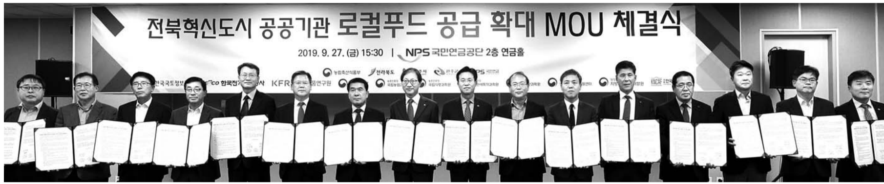
전북 혁신도시 공공기관 12개와 농식품부, 전북도 등 지자체는 지난 27일 '먹거리 선순환체계 구축과 상생·균형발전' 업무협약을 맺고 로컬푸드 공급을 확대하기로 했다.