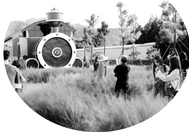
섬진강 기차마을 총의공원에 핀 핑크몰리.