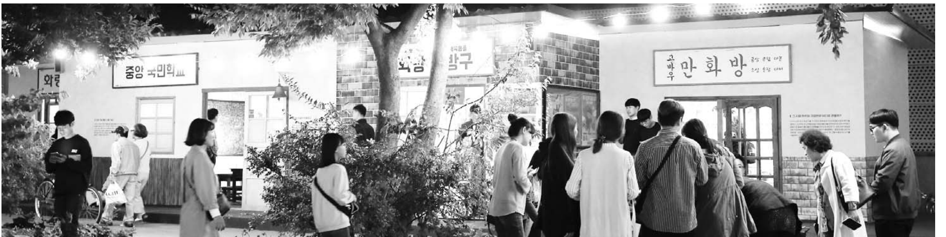
'추억, 세대공감'을 주제로 한 '추억의 충장축제'는 명실공히 광주 대표축제로 꼽힌다.

◇낙안읍성 민속문화축제(10.18~10.20 순천 낙안읍성)= '과거와 현재가 만나는 아름다운 동행' 낙안읍성 민속문화축제가 10월 18일부터 사흘간 사적 302호 순천 낙안읍성에서 개최된다. 낙안읍성 민속문화축제는 전통향토음식을 맛보는 먹거리와 선조들의 숨결을 느껴볼 수 있는 체험, 국가무형문화재가 참여하는 국악, 서커스 등 볼거리가 풍부한 힐링축제로, 매년 이곳에서는 백중놀이와 성곽쌓기 재현, 기마장군 순라의식 등 조선시대 문화를 관광객들이 직접 느낄 수 있도록 하고 있다. /이보람 기자 boram@kwangju.co.kr