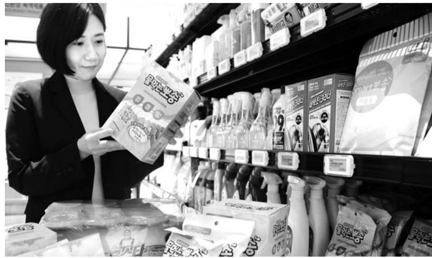
가을철에 접어들었음에도 젓은 태풍과 일교차가 큰 날씨가 계속되면서 위생·환경관리 용품 매출이 늘고 있다. 2일 광주신세계 지하 1층 식품 매장에서 한 고객이 제습 용품을 살펴보고 있다.

자도 부쩍 늘었다. 지난달 17일 '아프리카돼지열병'(ASF) 첫 발생 이후 확진 판정이 꾸준히 나오고, 대구에서 접수된 중동호흡기증후군(메르스) 의심환자가 음성 판정을 받았지만 위생 문제에 대한 우려는 커지고 있기 때문이다. 광주지역 이마트가 지난달 23~30일 손 세정제(핸드워시) 매출을 지난해 같은 기간과 비교한 결과 107.5%의 증가율을 보였다. 국내는 물론 전 세계적으로 신종 감염병이 끊임없이 생기면서 개인 위생관리 인식이 크게 높아졌다. 광주지역 이마트의 최근 3년간 전년비 9월 손 세정제 매출 증가율은 2017년 11.2%→2018년 15.6%으로 늘고 있는 추세다. 마찬가지로 미세먼지가 심각한 황사철이 지났음에도 마스크 매출은 53.7% 늘었고 구강청결제 매출 증가율도 84.1%을 기록했다.