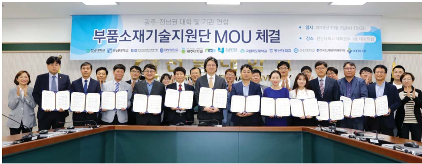
2일 오후 전남대 본부 대회의실에서 광주·전남지역 8개 대학과 4개 정부출연 연구기관이 '부품소재기술지원단'을 발족, 일본 수출규제와 관련해 지역 중소기업들의 기술 자립화와 애로 사항을 해결하기로 결의했다.

8개 대학·4개 연구기관 참여 부품소재기술지원단 발족 지역기업 기술 자립화 돕기로