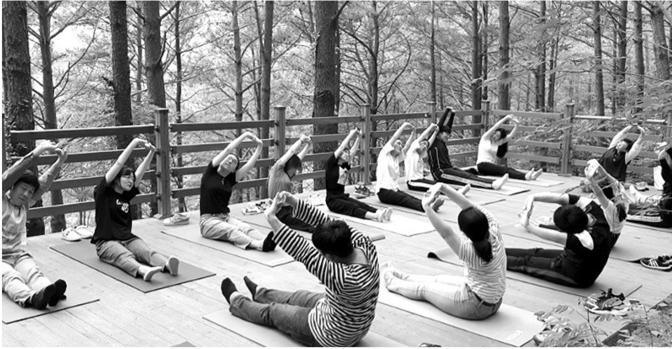
만연산 치유의 숲 산림 치유프로그램이 지역민은 물론 인근 도시민에게 호응을 얻고 있다. 일반인과 임산부를 대상으로 한 요가프로그램.

맑은 공기·피톤치드 등 활용 다양한 산림치유프로그램 운영 제지방축정 등 건강관리 체크도