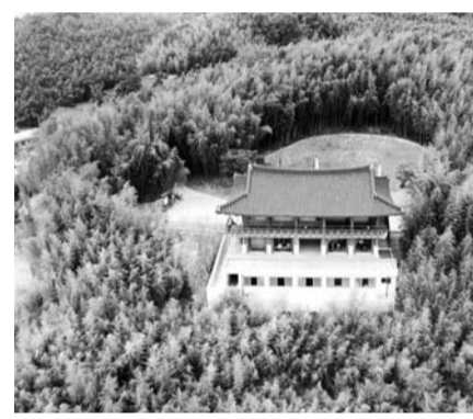
행사 발굴, 식물 확보·보전 방안을 마련하는 등 지방 정원으로서의 위상을 높이고, 정원문화 활성화를 위해 노력할 것”이라고 말했다. /담양=서영준 기자 xyj@

이상, 녹지면적 40% 이상이어야 한다. 관리시설과 주제 정원, 편의시설 등을 갖춰 관할 사·도지사에 신청해야 한다. 죽녹원은 2005년 3월 개장 후 연간 140만 명 이상이 찾는 관광지로 올랐지만 대나무에서 죽림욕과 다양한 문화체험을 즐길 수 있는 담양의 대표 명소다. 담양군 관계자는 “앞으로 지방 정원 등록과 운영에 적합한 담양군 죽녹원 관리·운영 조례를 개정하고 정원 콘텐츠와 체험