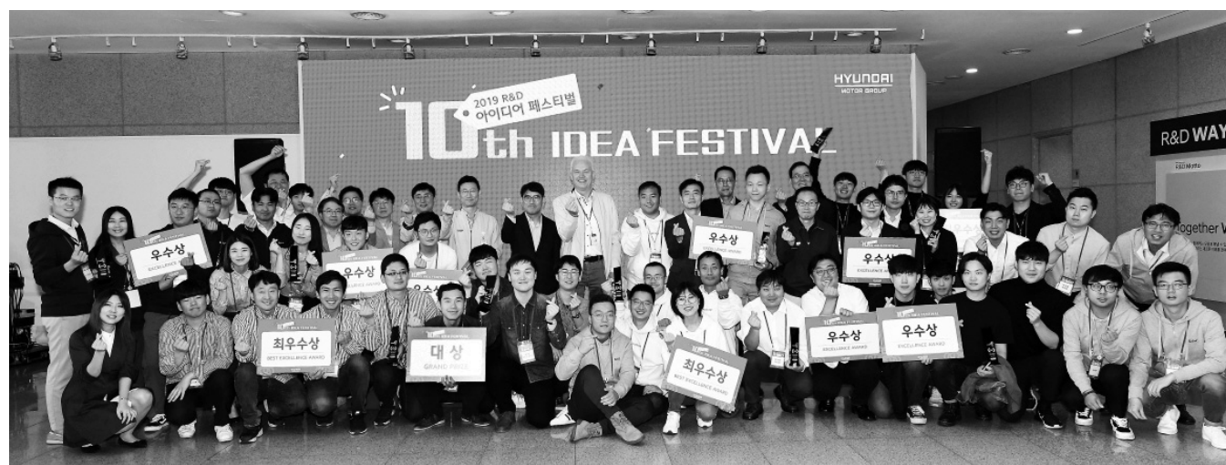
10일 현대기아차 기술연구소에서 열린 ‘2019 R&D 아이디어 페스티벌’에서 현대·기아차 연구원들이 미래차에 대한 아이디어를 겨뤘다.