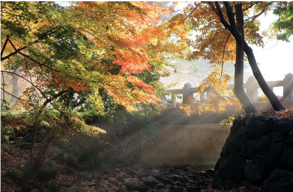
불갑사 해탈교 단풍

서늘한 바람이 불어오는 가을이 왔다. 낭만의 계절 가을, 일상에서 벗어나 영광으로 가족과 친구, 연인과 함께 '달콤한 여행'은 어떨까. 불갑사 단풍과 서해안의 노을을 감상할 수 있는 백수해안도로 등 무르익어가는 가을 정취를 한껏 느낄 수 있는 영광의 3대 명소를 소개한다.