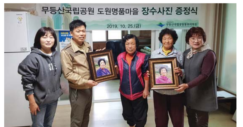
민이 제작하는 실질적인 자원봉사와 지원사업을 체계적으로 추진해 지역사회와 소통하

고 협력하는 데 앞장서겠다"고 말했다. /정병호 기자 jusbh@kwangju.co.kr