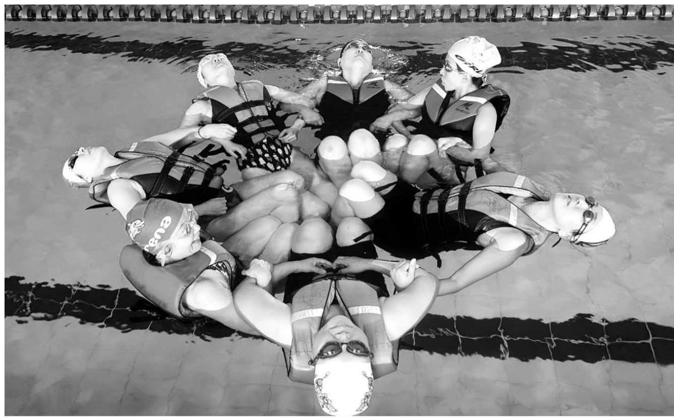
광주시체육회가 진행한 생존수영교실 참가자들이 시립국제수영장에서 누워뜨기 방법을 익히고 있다.

조코비치와 나달은 이 대회 결승까지 올라야 맞대결할 수 있다.