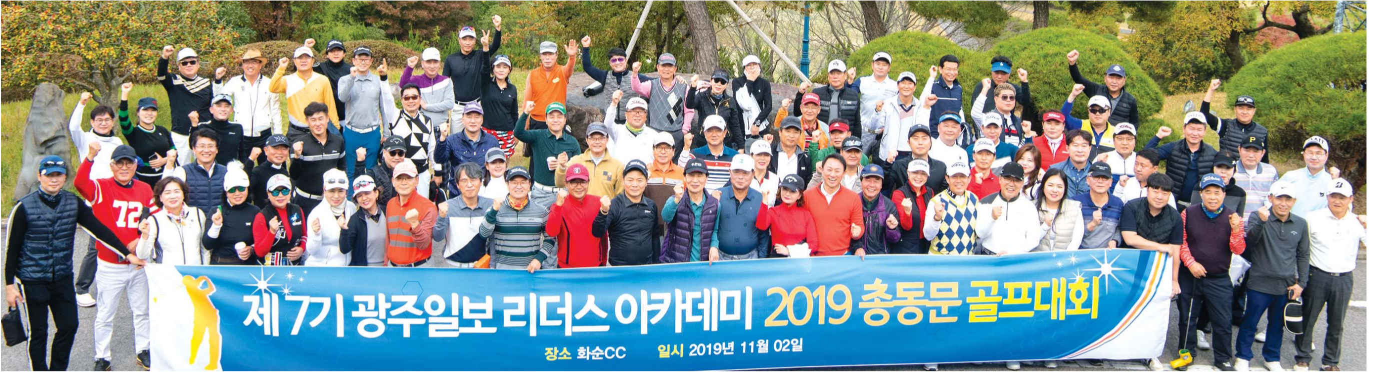
지난 2일 화순CC에서 열린 광주일보 리더스 아카데미 총동문 골프대회에서 원우들이 기념촬영을 하고 있다.