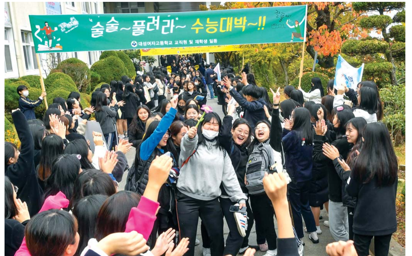
“수능 대박” 2020학년도 대학수학능력시험을 하루 앞둔 13일 오전 광주시 남구 대성여자고등학교에서 고3 수험생들이 후배들과 교사들의 응원을 받으며 예비소집 학교로 향하고 있다.