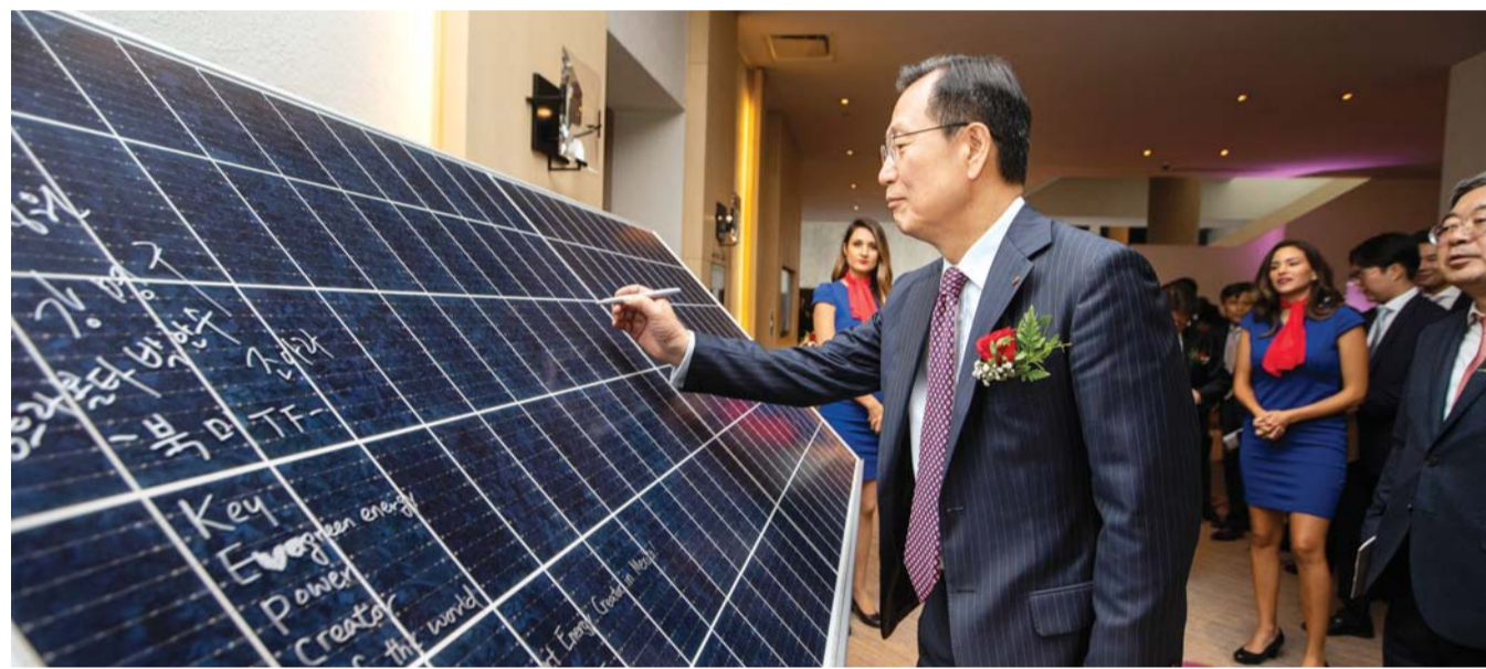
김중갑 한전 사장이 지난 14일 멕시코에서 열린 태양광 발전소 착공식에 참석, 태양광 패널에 기념사인을 하고 있다.

한전은 캐나다인 솔라사가 경쟁입찰로 발주한 이번 사업에서 지난 6월 우선협상대상자로 선정됐고 9월 확정계약을 체결했다.