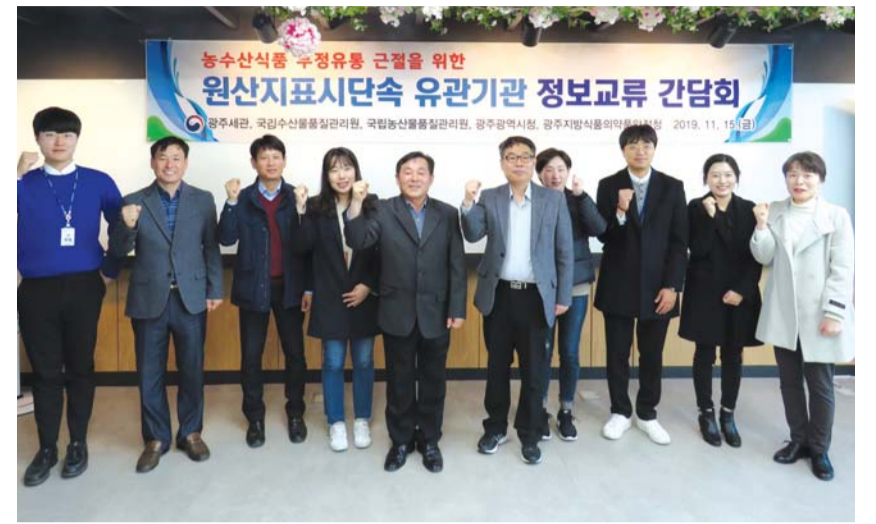
광주본부세관은 지난 15일 광주지역 5개 유관기관과 '김장철 불법·부정 농수산물 단속 간담회'를 열었다.

광주본부세관(세관장 김광호)은 지난 15일 정부청사 내 대회의실에서 광주지방 5개 유관기관이 모여 김장철을 맞아 불법·부정 농수산물 단속실태, 단속기법 공유 등을 위한 간담회를 개최했다.