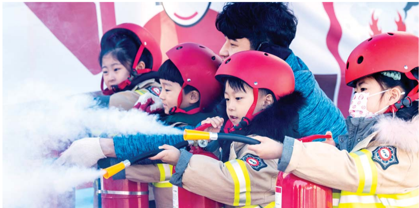
“소화기 사용 어렵지 않아요” 28일 국립광주박물관에서 열린 ‘찾아가는 어린이 안전체험교실’에 참가한 어린이들이 소화기 사용법을 배우고 있다.