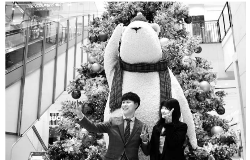
광주신세계, ‘푸빌라’ 트리 설치

2일 광주신세계를 찾은 고객이 성탄절을 앞두고 매장 1층에 전시된 크리스마스 캐릭터 ‘푸빌라’ 모형 앞에서 사진을 찍고 있다.