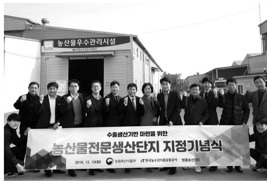
무안군은 지난 10일 망운면 영흥농산에서 양파전문생산단지 지정 기념식을 개최했다.

군은 이번 생산단지 지정으로 세계시장에 매년 안정적으로 무안황토양파를 수출하는 계기를 마련했다. 정부의 전문생산단지(수출단지) 지정이 되면 매년 평가를 거쳐 수출물류비를 최대 8%까지 지원 받을 수 있다. 무안군 관계자는 "양파전문생산단지(수출단지)를 지속적으로 확대해 명실상부한 수출단지 메카로 황토의 고장 무안군을 우뚝 서게 만들겠다"고 밝혔다.