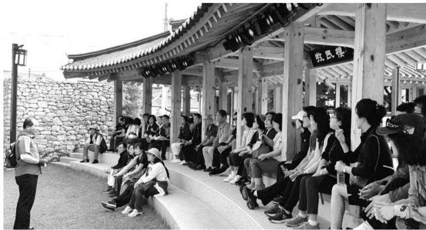
강진군이 운영하는 청렴교육이 다산초당과 사의재 일대에서 진행됐다. 사의재에서 청렴교육을 받고 있는 교육생들.

려지면서 수도권을 비롯해 강원도, 제주도에도 이르기까지 전국의 공무원이 강진을 찾았다. 2011년부터 지금까지 4만3000여명의 교육생을 배출했으며 그간의 교육비 수입 또한 64억원에 이른 것으로 나타났다. 교육생이 내는 교육비는 고스란히 강진군민에게 돌아간다. 포수체협과 교육을 연계해 운영함으로써 농가 부수입을 창출하고 관내 식당 이용, 특산물판매점 이용을 비롯해 각종 쇼핑으로 이어지는 소비 활동을 유도해 지역경제 활성화에 큰 역할을 하고 있다. 내년부터는 사의재 뒤편에 자리하는 다산청렴연수원에서 교육을 이어갈 예정이 다.