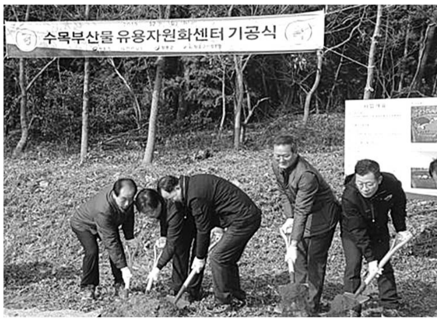
수목부산물 유용자원화센터 기공식.

있는 표고폐자목을 톱밥으로 파쇄해 가축 깔개용, 친환경 퇴비 생산 등 수집, 가공, 유통 시스템 구축을 위한 사업이다. 군은 숲 자원을 효율적으로 활용해 산림경쟁, 산불 저감, 동물복지 향상 등의 효과를 거둘 수 있을 것으로 기대하고 있다. 장흥군 관계자는 "산림자원의 선순환적 구조를 만들어 임·농가의 소득증대와 일자리 창출 등 지역경제의 활성화에 도움이 될 것"이라며 "향후 중장기 발전전략을 토대로 지속가능한 산림산업을 육성하겠다"고 말했다. /장흥=김용기 기자 중부취재본부장