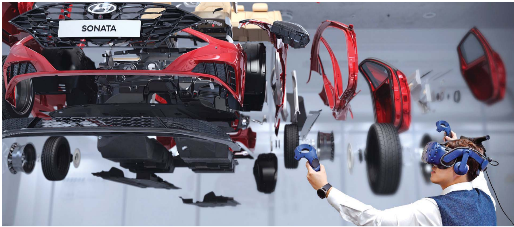
자동차 VR 설계 현대·기아자동차는 자동차의 품질을 높이며 개발 속도와 수익성도 함께 향상시킬 수 있는 '버추얼 개발 프로세스'를 본격 기동한다고 18일 밝혔다. 남양연구소 연구원들이 VR(Virtual Reality·가상현실)을 활용해 가상의 공간에서 설계 품질을 검증하고 있다. (현대차그룹 제공)

체는 10년 새 1300여 개(20%) 급증했다. 10여 년 전인 지난 2008년 지역 건설업체는 광주 1615개·전남 4955개 등 총 6570개였지만 이듬해 7000개를 넘었고 2016년 7229개(광주 2115개·전남 5114개)→2017년 7573개(광주 2209개·전남 5364개)→2018년 7889개(광주 2353개·전남 5536개)로 꾸준한 오름세를 보이고 있다. 건설업체 수와 건설공사액은 늘었지만 지난해 지역 건설계약액은 하향선을 그렸다. 지난해 지역 건설계약액은 광주 4조2470억원·전남 11조4500억원으로 각각 전국 계약액(25조9410억원)의 1.7%, 4.5%를 차지했다. 지난 2017년과 비교한 계약액은 광주지역이 12.7%, 전남은 0.5% 감소했다. /백희준 기자 bhj@