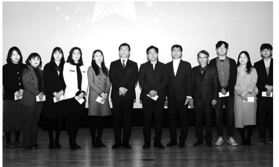
남원시는 지난 20일 '친절 개그콘서트'에 앞서 시민에게 칭찬받은 공무원 15명에게 남원시사랑상품권을 전달했다.