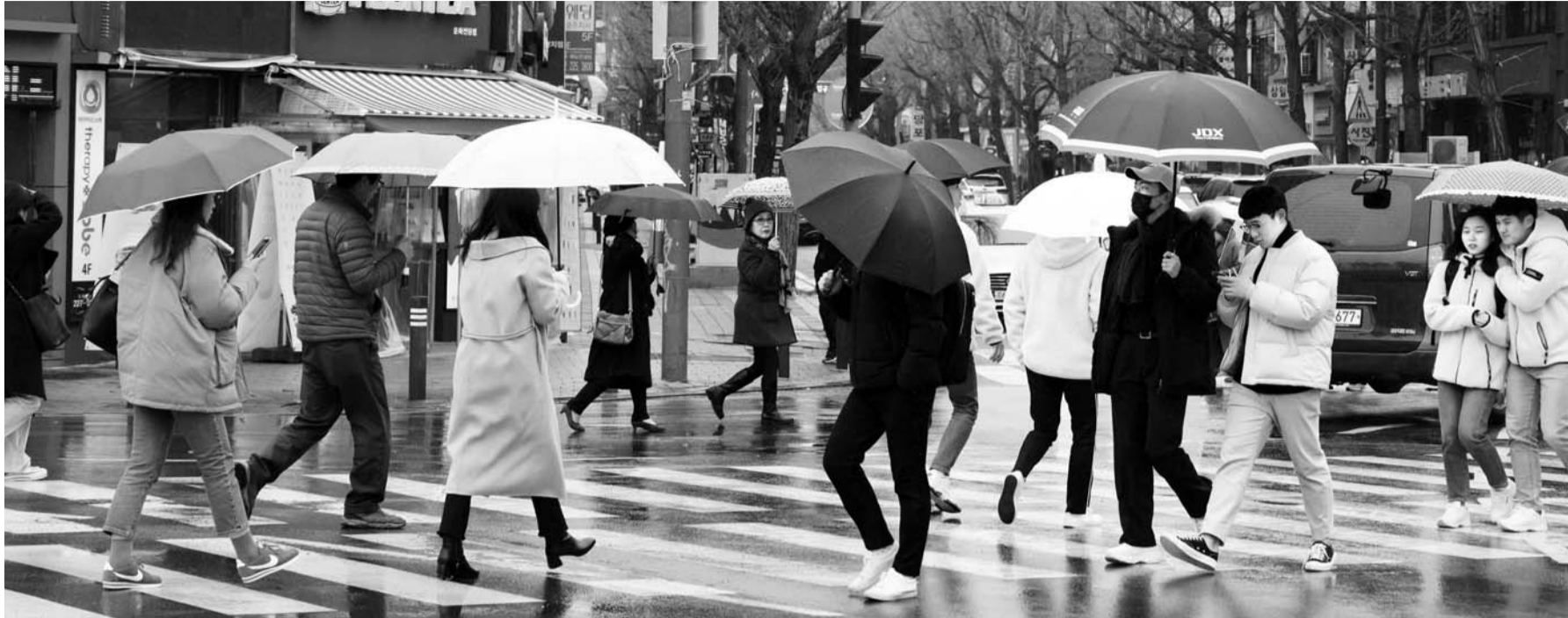
눈 대신 비 겨울비가 내린 26일 광주시 동구 충장로에서 시민들이 우산을 쓰고 횡단보도를 걷고 있다.

이동성 고기압이 찬 공기 남하 저지... 1월 20일 지나야 '눈 구경' 12월 평균기온은 5.1도로 평년보다 2도 높아... 광주 적설량 '0cm'