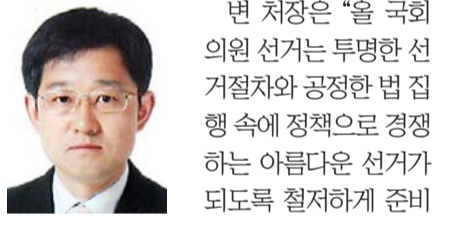
변 처장은 “을 국회 의원 선거는 투명한 선거절차와 공정한 법 집행 속에 정적으로 경쟁하는 아름다운 선거가 되도록 철저히 준비하겠다”고 밝혔다. /김지을 기자 dok2000@

신임 변 사무처장은 대전 출신으로 충남대 행정대학원 행정학과(석사)를 거쳐 지난 1990년 충남 아산군선거관리위원회를 시작으로 세종시선관위 지도과장·대전시선관위 홍보과장, 대전시선관위 지도과장·선거과장 등을 지냈다.