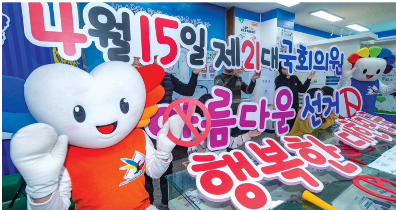
"아름다운 선거 행복한 나라" 6일 오후 광주시 서구 치평동 광주시선거관리위원회에서 선관위 직원들이 100일 앞으로 다가온 제21대 국회의원선거를 홍보하는 퍼포먼스를 하고 있다.