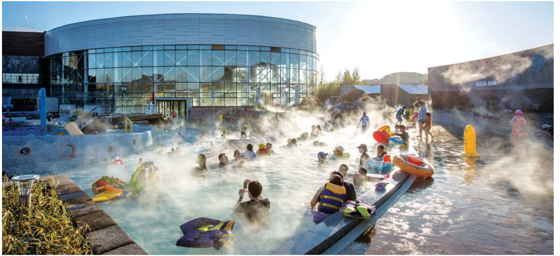
파라다이스 스파 도고의 노천스파존.