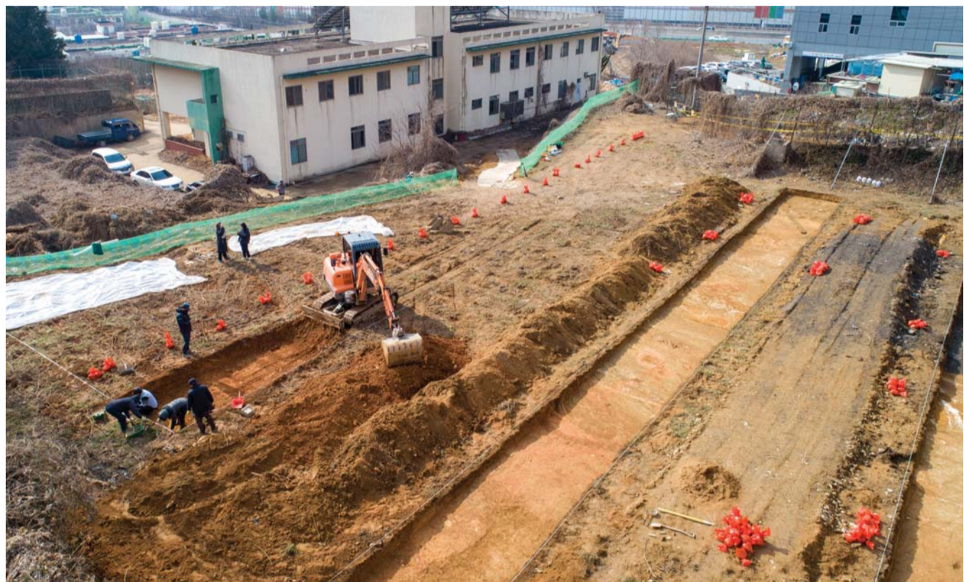
시들때 흔적 없는 추가 유해 발굴작업 30일 오후 광주시 북구 문흥동 옛 광주교도소에서 추가유해발굴작업이 3일째 진행되고 있다. 이날 트렌치 조사(굴착:땅을 파서 하는 조사) 방식으로 7곳의 구역중 4곳을 발굴했으나, 암매장 관련 흔적이 나오지 않은 것으로 전해졌다.