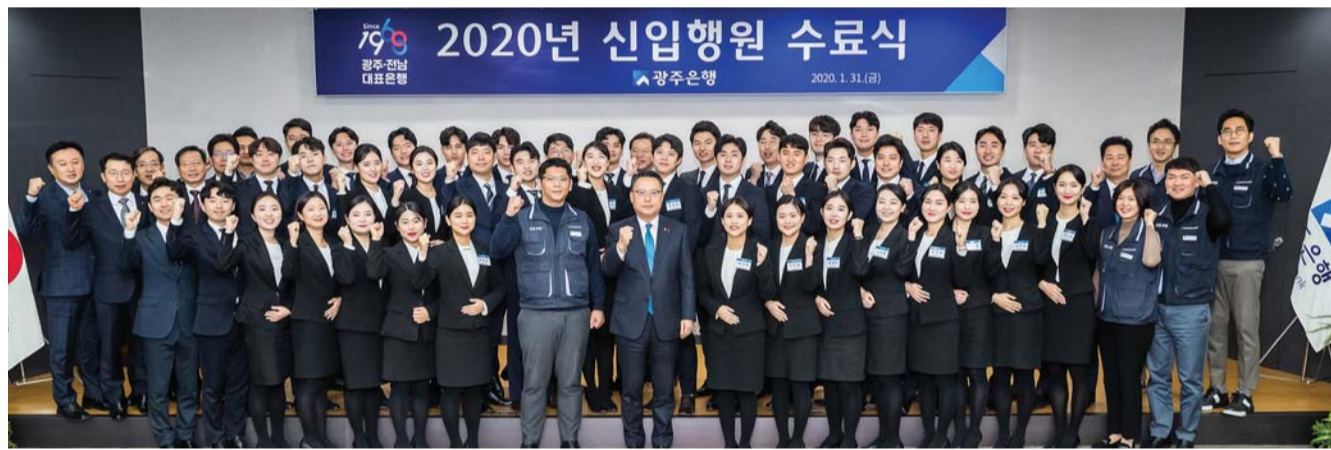
광주은행 신입행원 42명이 지난 31일 본점에서 연수 수료식을 열고 각 지점에 배치됐다.

광주은행 신입행원 42명이 지난 31일 연수 수료식을 가졌다. 지난해 '하반기 정규직 신입행원 공채' 80% 이상은 광주·전남지역 출신으로 할당 선발됐다. 광주은행(은행장 송중욱)은 지난해 11월4일부터 3개월 연수를 마친 신입행원들이 각 지점에 배치된다고 2일 밝혔다. 이들은 연수 기간 동안 창구업무 수행을 위한 직무연수와 창구 친절교육, 현장 체험 연수, 봉사활동 등을 진행했다. 연수 수료 뒤에는 5개월의 수습기간을 거치며 실무 경험을 갖고 오는 7월 임행식을 치른다. /백희준 기자 bhj@kwangju.co.kr