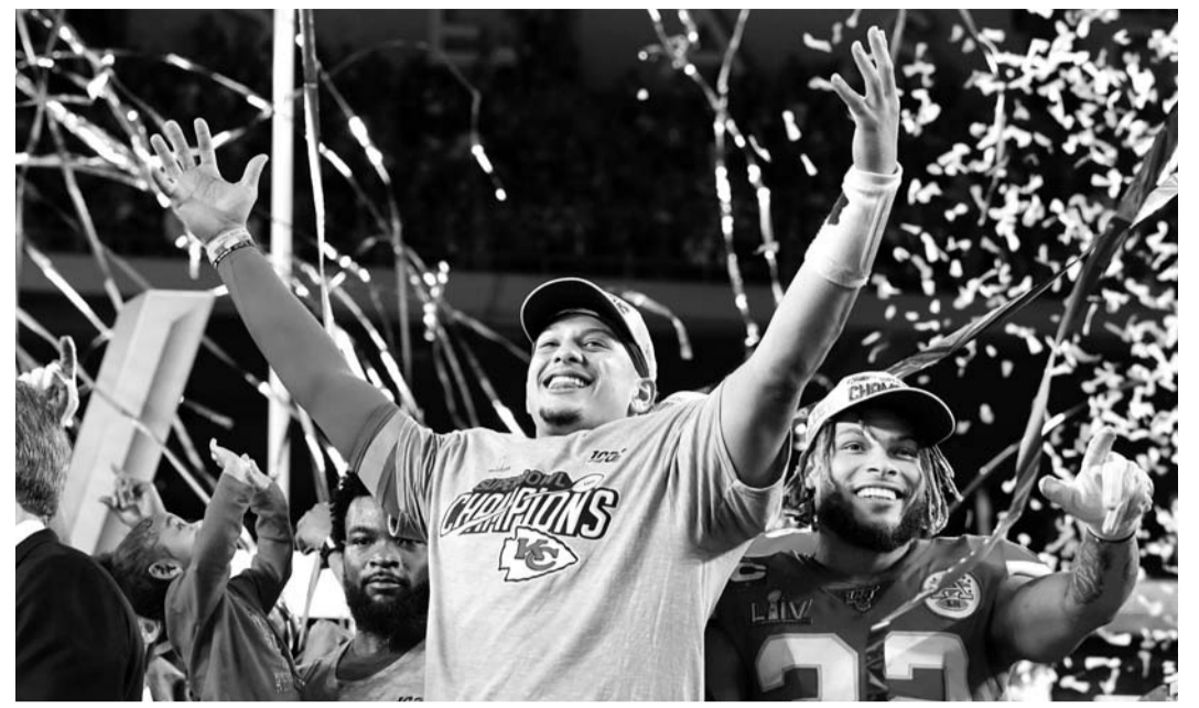
캔자스시티 치프스 패트릭 마흐스(가운데)가 3일 미국 플로리다주 마이애미 가든스에서 열린 샌프란시스코 포티나이너스와 제54회 슈퍼볼에서 31-20으로 승리한 뒤 기뻐하고 있다. /연합뉴스

시상식에 최근 헬리콥터 사고로 숨진 '농구 스타' 코비 브라이언트를 추모하는 'KB 8, 24(이름이니셜과 현역 시절 등 번호)'라는 문구가 새겨진 상의를 입고 나온 조코비치는 브라이언트와 유족들, 호주 산발 피해자들에게 위로의 말을 전한 뒤 "내가 가장 좋아하는 대회, 가장 좋아하는 코트에서도 이 우승 트로피를 들 수 있어서 매우 기쁘다"고 소감을 밝혔다. /연합뉴스