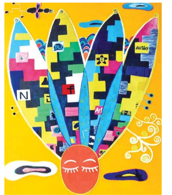
'나의 심상 속 세상'

또 현대인의 네트워크 중심이 되는 앱(페이스북, 카카오톡, 비트윈) 이미지를 적극 활용해 복잡하게 얽혀있는 인간의 관계망을 다양한 형태로 표현해내고 있다. 그의 작품에서 눈에 띄는 건 다채롭고 화려한 색감과 기하학적인 패턴들로 동화적 느낌을 자아내기도 한다.