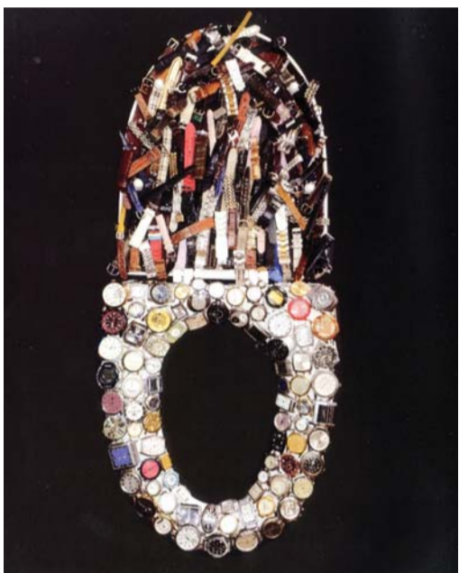
조용 작 '시간은 흐르지 않는다'

또 고속도로 위를 달리는 차량의 모습 등을 아슬라히 묘사한 초창기 작품들은 '길 위의 인생'을 잘