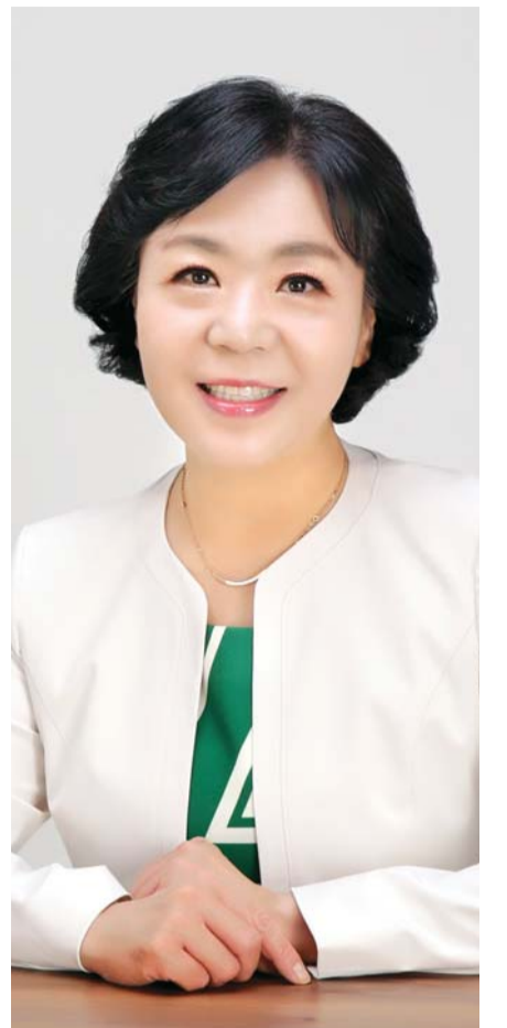
심리적 안정과 행복한 미래를 위해 최선을 다하겠습니다.”

“가족 문제는 객관적으로 보기 힘든 만큼, 전문가의 도움을 받는 게 해결이 빠릅니다. 상담이란 문제가 있는 아들만을 위한 게 아니라, 누구나 받을 수 있는 것입니다. 전문가에게 의뢰하는 것을 부끄러워하지 말아 주세요. 센터도 광주 청소년의