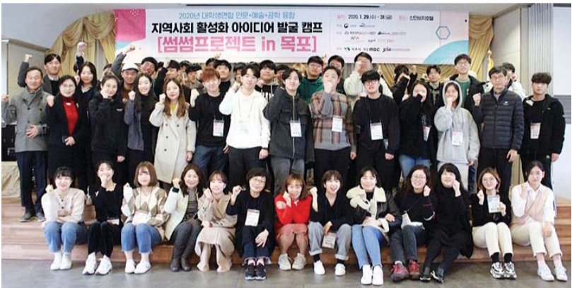
교육부와 한국연구재단이 주최하고 목포대·조선대·원광대·중앙대가 공동으로 주관한 지역사회 활성화 아이디어 발굴 캠프 '썸썸프로젝트 in 목포'가 최근 서울길 목포시에서 개최됐다. 첫 회인 이번 캠프는 4개 대학 LINC+사업단 창업사업화지원센터 및 대외협력부 교수들이 함께 기획, 각 대학이 속해 있는 지역사회의 문제를 공동으로 해결하자는 취지에서 개최됐다.