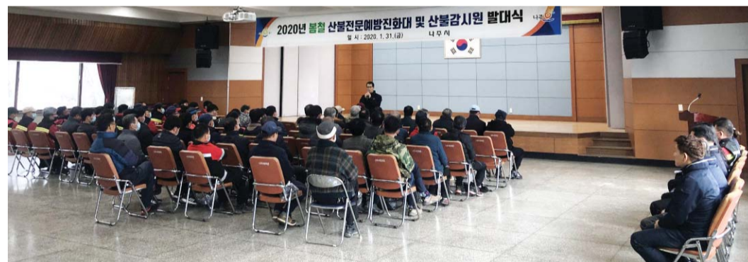
나주시는 지난달 31일 나주시민회관에서 '2020년 봄철 산불 전문 예방진화대 및 산불감시원 발대식'을 했다.