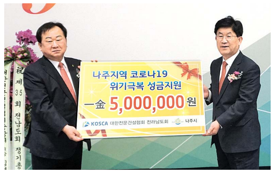
속에도 4조원에 달하는 전남 전문건설사들의 기성실적이 지역경제 발전과 일자리 창출에 큰 힘이 됐다"며 "전문건설인들은 앞으로도 지역에서 어려움이 발생하면 언제든지 최선을 다해 도울 것"이라고 말했다.