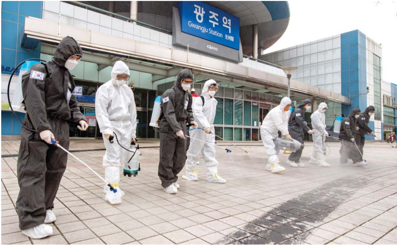
광주역 소속 코로나19의 지역사회 확산 방지를 위해 9일 오전 육군31보병사단 장병들과 광주 북구청 직원들이 광주역에서 시설 내·외부 소독을 실시하고 있다.

신천지 공부방서 밀접 접촉 추가 접촉 심층 역학조사 잠복기 이후 감염됐다면 자가격리 지침 전면 수정해야 전국 코로나19 진정세