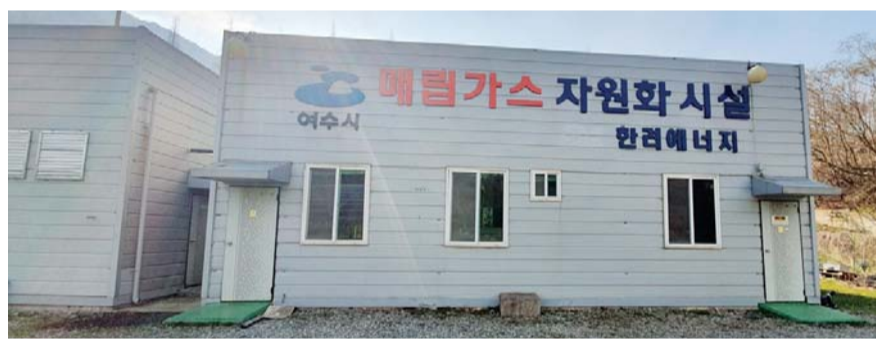
여수 만흥매립장 배출가스 자원화시설.

여수시는 지난 2005년부터 한려에너지 개발과 협약을 맺고 만흥매립장 내 매립