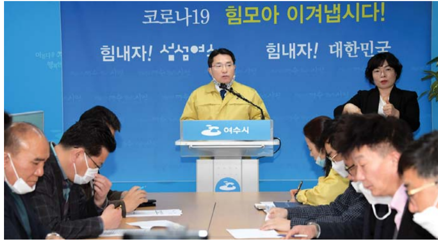
권오봉 여수시장이 지난 9일 시청 브리핑룸에서 코로나19 대응상황과 지역경제 활성화 대책을 발표하고 있다.

대구·경북지역을 방문한 직원 332명을 관리 중이며 유증자는 없는 상태다. 신규 플랜트 근무 투입 시 대구·경북지역 근로자