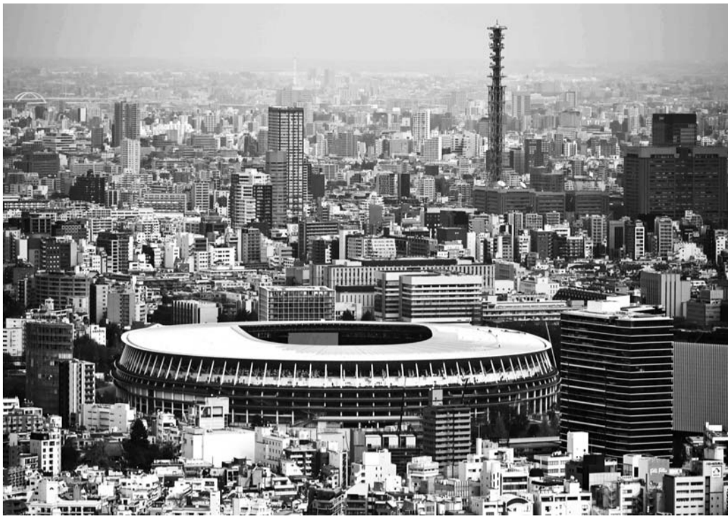
2020 도쿄 올림픽이 열리는 주경기장 전경.

아마노미에대학의 감염병 특화 초빙교수인 나카하라 히데오미는 "일본에서 5월 말까지 코로나19 사태가 해결된다면 그것만으로는 충분