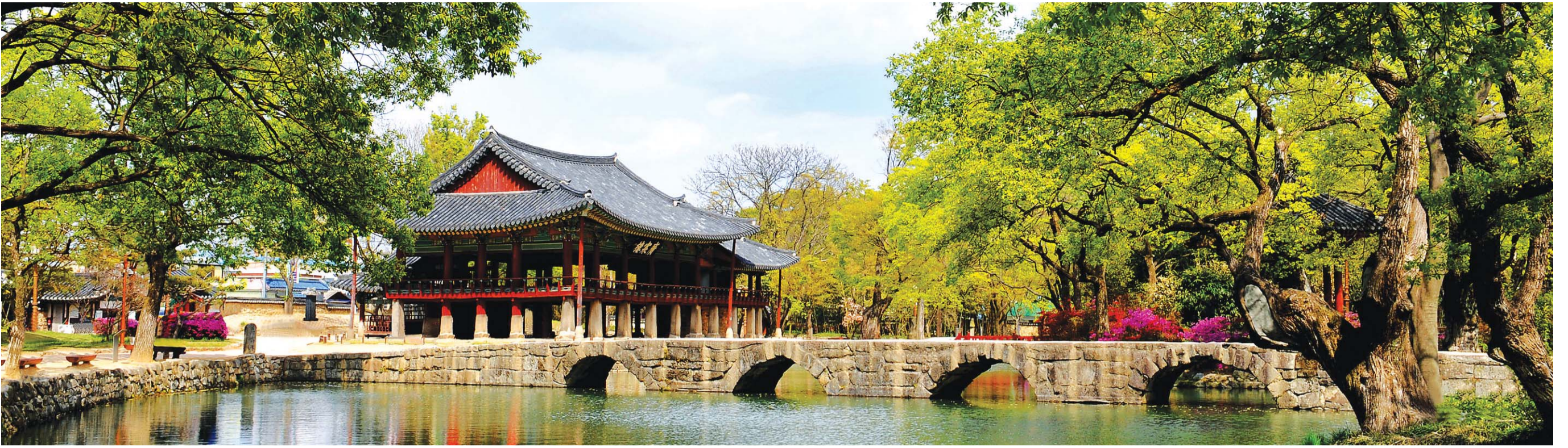
남원 광한루원 전경. 성춘향과 이몽룡이 처음 만난 곳으로 춘향전의 주무대이다.