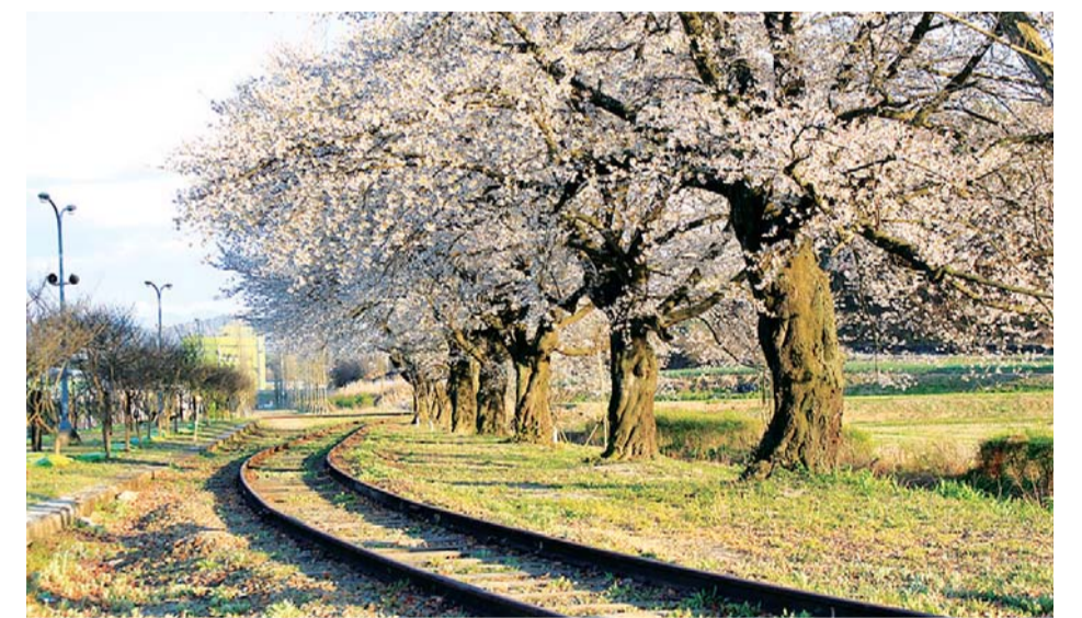
소설 '혼불'의 배경지인 서도역. 드라마 '미스터 션샤인' 등이 촬영된 곳이다.

광주일보 江原日報 경남신문 경인일보 대전일보 每日新聞 부산일보 釜山日報 제주新보 新팔도유람은 한국지방신문협회 9개 회원사가 공동 취재·보도합니다.