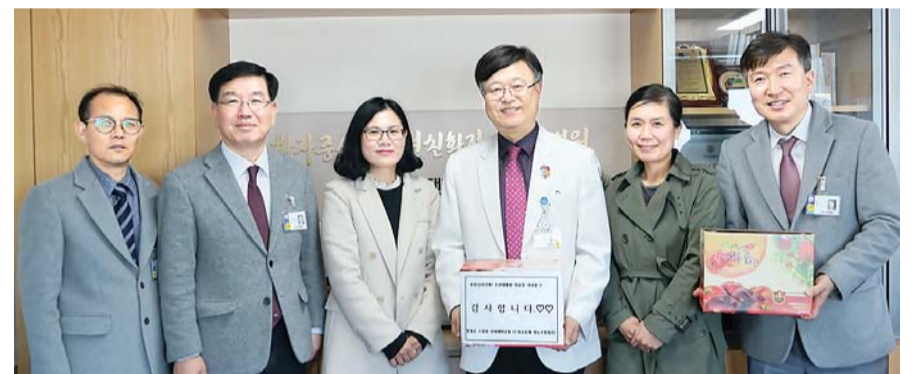
원 의료진을 위해 기부했다.

다. 민간위탁자로 선정된 '드림공동체 영농조합법인'은 드림빌 주민과 삼성면 사과원 전문가로 구성됐으며, 이후 효율적인 관리를 통해 도·농교류 활성화는 물론 농가 소득창출에도 크게 기여하고 있다.