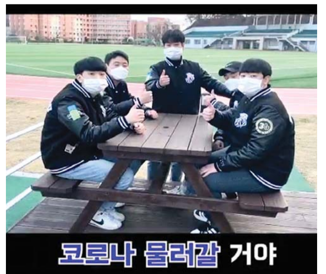
통해 공개했으며, 신입생들과 재학생들에게는 문자로 배포할 계획이다.

광주대학교 총학생회가 '코로나19' 극복을 위한 응원 영상을 만들어 19일 배포했다. 광주대 총학생회 10명의 학생들은 최근 한 방송에서 인기를 끌고 있는 '코로나19 퇴치왕'을 배경으로 손 씻기·마스크 착용 등 '코로나19' 예방 행동수칙 율동을 3분 짜리 영상에 담아 소개하고 있다.