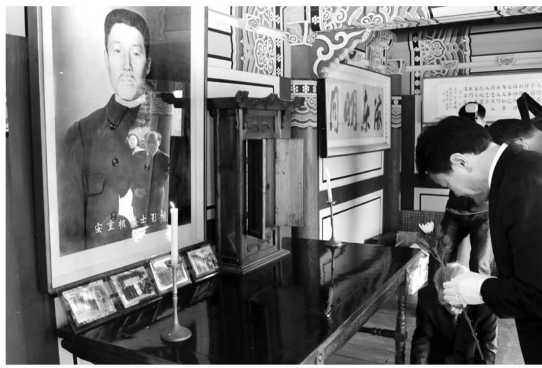
국내 유일의 안중근의사 영정·위패를 모신 사당인 장흥 해동사에서 오는 26일 '제66회 대한민국 영웅 안중근의사 추모제'가 열린다.

장흥군은 오는 26일 장동면 해동사에서 '제66회 대한민국 영웅 안중근의사 추모제'를 연다고 23일 밝혔다. 올해 3월 26일은 안중근의사 순국 110주년인 동시에, 해동사에서 안중근의사의 업적을 추모한 지 66년째 되는 날이다. 안중근의사는 1909년 10월 26일 오전 9시 조국의 독립과 동양 평화를 위해 이토 히로부미를 저격했다. 이거 당일 체포된 안 의사는 이듬해인 1910년 3월 26일 뱃속 감옥에서 순국했다. 장흥군에는 국내에서 유일하게 안중근의사 영정과 위패를 모시는 사당인 해동사가 있다. 해동사는 1955년 장흥 유림 안홍전(죽산 안씨) 선생이 순흥 안씨인 안중근의사의 후손이 없어 제사를 지내지 못하는 것을 안타까워하며 죽산 안씨 문중 및 지역 유지들이 성금을 모아 건립한 사당이다. 1955년 이후 매년 안중근 의사의 순국일에 맞춰 해동사에서는 '안중근의사 추모제'를 열고 있다. 전남도는 지난해 12월26일 해동사를 전남도문화재 제291호로 지정했다. 장흥군은 안중근의사 순국 110주년을 맞아 2020년을 '정남진 장흥 해동사 방문의 해'로 선포, 다양한 사업을 추진 중이다.