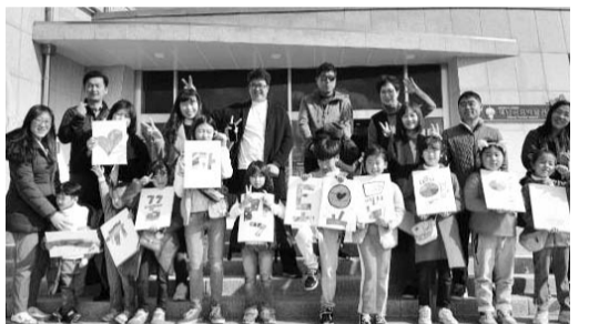
강진지역 학생들이 한국민화뮤지엄에서 운영하는 체험·교육 프로그램에 참여하고 있다.

강진군이 주작산 휴양림에 지중해 식물인 올리브 단지과 산수유 숲을 조성한다. 23일 강진군에 따르면 지난 20일 주작산 휴양림의 관광 자원화 및 소득 작목 육성을 위해 지중해 식물인 올리브 65그루와 산수유 500그루를 심었다. 주작산은 빼어난 산세와 진달래 등 화려한 볼거리를 자랑하는 전국 100대 명산으로, 봄철 많은 관광객이 찾고 있다. 산수유는 진달래 이전에 꽃이 피고 한 달 이상 지속되기 때문에 관광 자원으로 한몫을 할 것으로 기대된다. 또 지난해 가우도에 시험 식재해 월동을 마친 올리브를 주작산에 식재해 다양한 볼거리를 제공한다. /강진·남철희 기자 choul@kwangju.co.kr