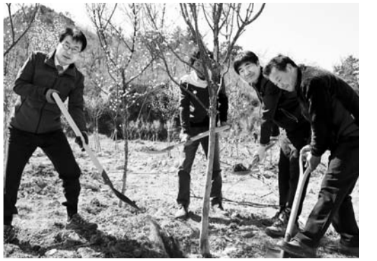
이승욱 강진군수와 숲가꾸기 관계자들이 지난 20일 주작산 휴양림에서 산수유와 올리브 나무를 심고 있다.

리운영 사업, 여행자 센터 및 청자박물관 개선 등 2개의 인프라 사업을 진행한다. 강진군은 문체부 기본계획 컨설팅을 통해 사업 내용을 최종 검토하고 사업 규모 조정 후 올해 하반기부터 본격적으로 추진해 강진관광산업 활성화 및 일자리 창출로 지역경제 활성화를 견인한다는 계획이다. 이승욱 강진군수는 "지역특화자원인 청자라는 문화유산을 고려문화로 확장시켜 개발함으로써 새로운 수요를 유발해 관광객 500만명 시대를 이끌겠다"고 말했다. /강진·남철희 기자 choul@kwangju.co.kr