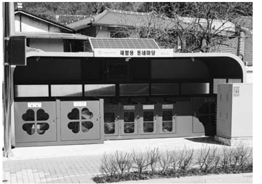
장성읍 단광리에 설치된 '재활용 동네마당'.